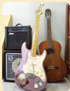
楽器の演奏もできます

ふくし相談サポートセンター TEL:0766-30-2937 (氷見市鞍川1060番地 氷見市役所内)