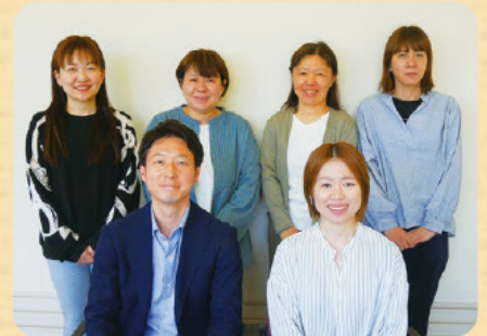
りょうけ ばんしょう はまで なかがわ ○つりざわ ○さわだ