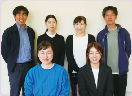
かいじょう いしかわ ななせ たにはた ○いいた ○ひろの