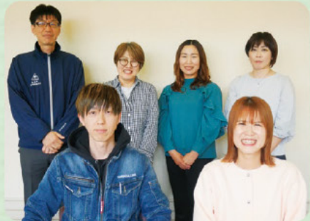
たけもと よしだ もりわき すがた ○さわだ ○きり