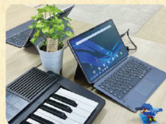
タブレットで調べ物をしたり動画を観たりすることもできます