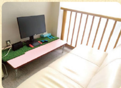
個室で過ごすこともできます