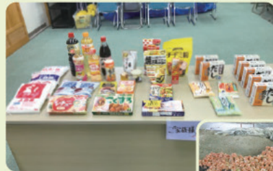
フードパントリーで提供された食料品の一例