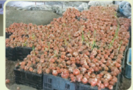
農家さんから規格外の玉ねぎをいただきました

Information 子ども支援課 〒935-0011 氷見市中央町12-21 (氷見市いきいき元気館内) TEL: 74-8063 FAX: 74-8055 受付時間 平日 8:30~22:00