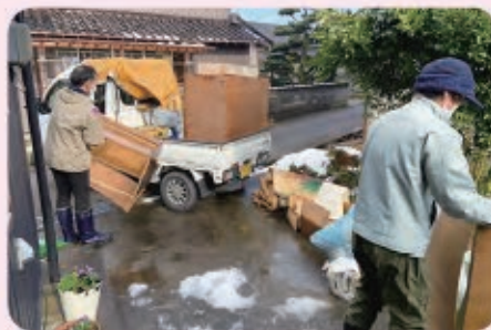
地震で壊れた家具の運び出し作業 （鞍川地区の1人暮らし世帯にて）