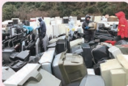
災害ゴミ仮置き場にて集積物の仕分け （ふれあいの森第2駐車場にて）