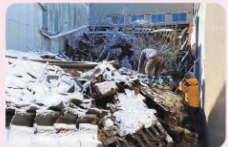
崩れた屋根瓦が隣家になだれ込まないように撤去するボランティア（栄町にて）