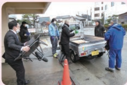
被災者宅へ向かうボランティアが必要な資材をトラックに積み込む（災害ボランティア支えあいセンター）