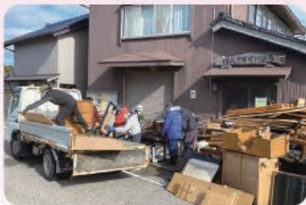
間島地区で集められた災害ゴミを仮置き場に運搬する（地区の集積場となった間島漁業実行組合にて）