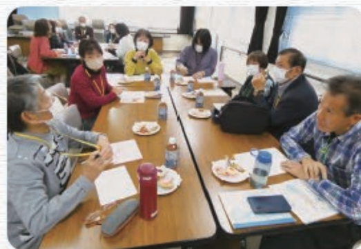
グループトークでは意見交換をしました