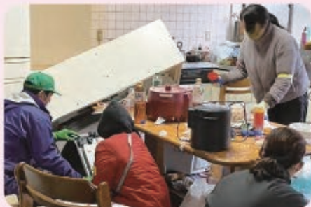
倒れた食器棚や家電の片づけ （上庄地区の1人暮らし世帯にて）