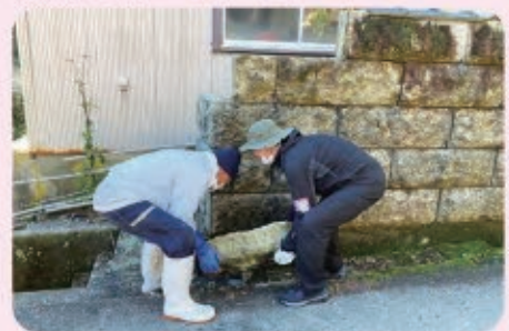
道路に崩れた民家の塀を片付ける （鞍骨地区の高齢者宅にて）