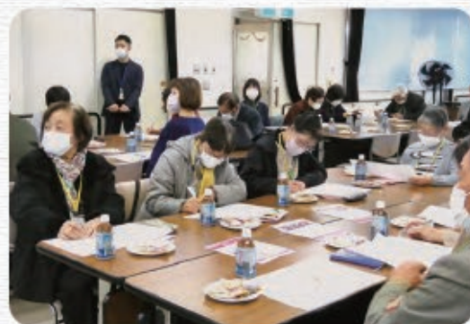
ボランティア団体の活動紹介を聞く参加者

氷見市ボランティア総合センターでは、ボランティアに関する相談受付や情報発信をしています。「何かやってみたいな」「こんな活動があったらいいな」というお気持ちを私たちにお聞かせください。あなたの思いとボランティア活動を結び合わせます。