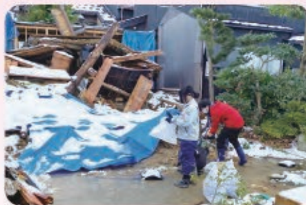
崩れた土壁の残土を土嚢袋に入れて片付ける （北大町の個人宅にて）

注意! 災害ボラセンのボランティアが活動に対して報酬を要求することはありません。不審な場合は下記までご連絡ください。