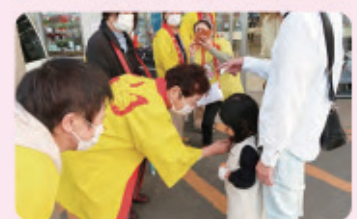
昨年の街頭募金活動の様子