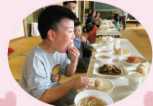
とやま食育ラボ 昨年の活動「マコモダケ収穫体験&試食会」の様子