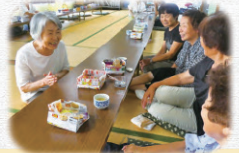
地域サロンで活躍するサポーター（中谷内地区）

地域の中で住民の相談を受け止める「福祉なんでも相談」や地域福祉活動の担い手となる「地域福祉活動サポーター（以下、サポーター）」を紹介します。