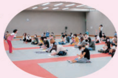
ひみ子育てわいわいフェスタ2022 当日の様子

やイベントの開催によって、親のスキルアップやリフレッシュに繋がり、子育ての仲間や先輩、プロと交流できるとても大切な場となっています。