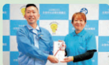
日本ゼオン(株) 鍋島組合支部長(左)とひみキキキども食堂ネットワーク 向代表(右)

令和5年1月30日(月)、同じく日本ゼオン株式会社より、年末に社員から募った寄付金13万3900円がひみキキキども食堂ネットワークに贈呈されました。いただいた寄付金は、市内ども食堂の運営に活用します。