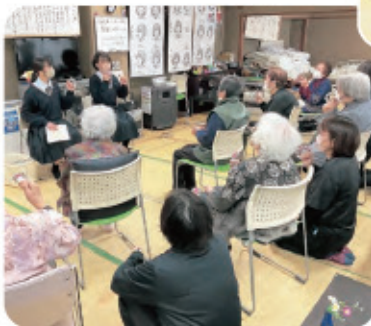
自分たちで考えた音楽レクリエーションで高齢者と交流!

実践! 自分たちの想いを形に! 「eスポーツでサロンを盛り上げたい」と考えたグループは、実際に体験会を企画・実施し、約40名が参加しました。 また、経済的な事情から中学校や高校の制服を準備することが難しい世帯があることを課題と感じたグループは、制服の寄付を校内で募る取り組みを行いました。集まった制服は市内の有志クリーニング店で保管され、氷見市社協を通して必要な方に提供されます。全グループの取り組みについては、氷見市ボランティア総合センター公式SNSで紹介しています。是非チェックしてみてください。