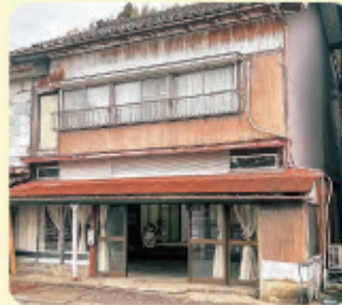
変わらない馴染みある外観