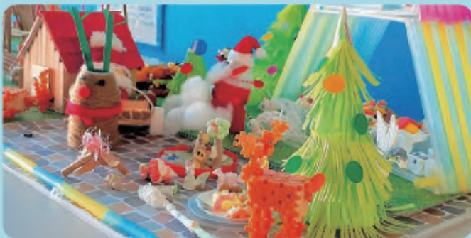
個性豊かな作品(令和4年度)