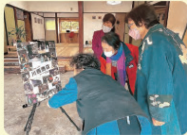
懐かしい写真に話が弾みます