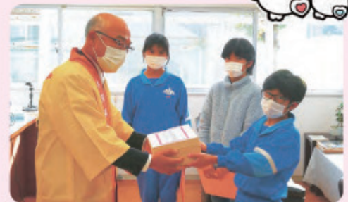
海峰小学校代表児童(右)と氷見市共同募金委員会 七分委員(左)

また、市内の全ての小中学校で児童生徒の皆さんが共同募金運動に参加くださいました。皆さんの気持ちがたくさん詰まった募金、ありがとうございました。共同募金では、子どもたちが安心して暮らし成長できる地域をつくる活動も応援しています。