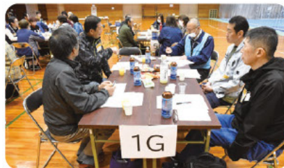
活動の振り返りをしている様子

3月28日（土）に「氷見市災害ボランティア一泊、お疲れ様でした会」を開催し、これまで活動したボランティア50名が参加してくださいました。当日は、市社協の災害支援活動や災害支援ボランティアグループ阿部んジャーズの活動を報告したほか、参加者とこれまでの活動を振り返り、今後の活動に向けて意見交換をしました。参加者からは「今後も氷見市の活動に参加したい」「被災された方の心に寄り添った活動を続けたい」との声があり、これからの災害支援活動につながる機会となりました。