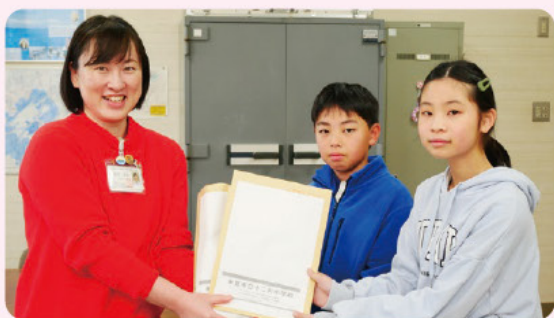
十二町小学校での贈呈式の様子

令和7年度の募金総額は 5,139,344円 でした。 この募金のうち約70%は、今年度の氷見市内の福祉活動に、約30%は県内の福祉活動に、約3%は災害時の迅速な支援のための積立として活用します。