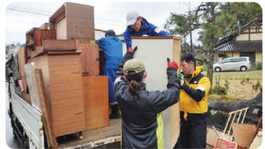
災害ごみの搬出の様子