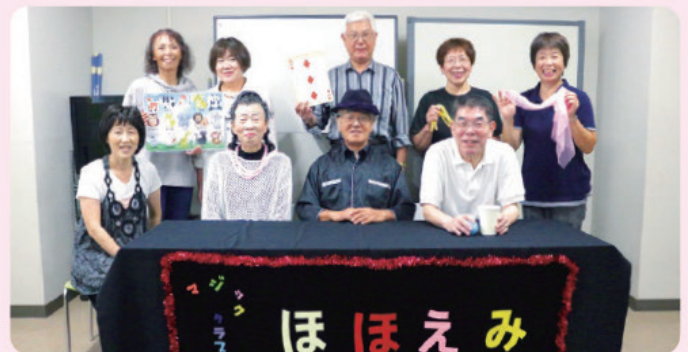
マジッククラブほほえみのみなさん

桶: 「ほほえみ」を結成して初のステージを成功させること! ステージでの経験をバネに次の発表につなげていきたいです。またマジックを通して市内の他のボランティア団体の方々との交流をする機会も増やしていきたいです。 「ほほえみ」では常時メンバーを募集しています。一緒にマジックをして楽しい時間を過ごしましょう!