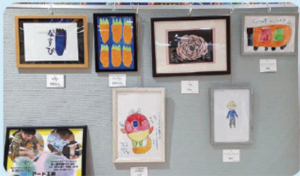
感性豊かな作品(令和5年度)

作品展示 日時 12月3日(火)～12月9日(月) 場所 プラファ氷見ショッピングセンター