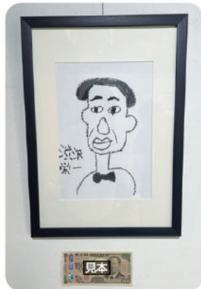
新一万円札の渋沢栄一