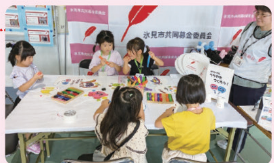
どんなうちわにしようかな?

Information 氷見市共同募金委員会(総務・企画課内) 〒935-0025 氷見市鞍川975(氷見市社会福祉会館内) TEL:74-8407 FAX:74-8409