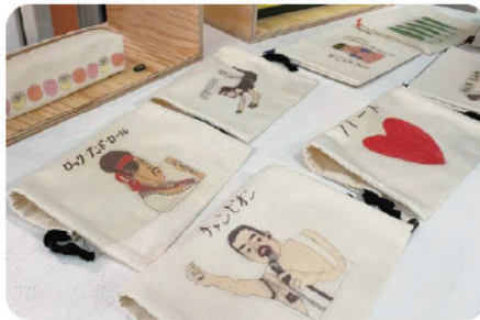
類を見ない愛嬌のあるイラスト