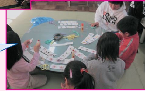
牛乳パックバズル、うまくできるかな?

☆申し込み、お問い合わせ☆ *実施希望日の1ヶ月前に申請書に必要事項を記入のうえ、児童館に提出してください。(申請書は児童館にあります)できるだけ希望にそえるように内容や日程などを調整いたします。 氷見市児童館 TEL 74-8063