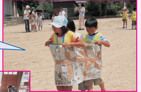
新聞紙で作った渡し舟でよいいドーン!